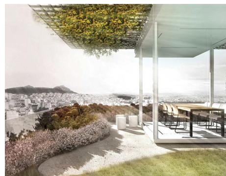
Παράδειγμα διαμερίσματος στην Άνω Κυψέλη, το οποίο ενσωματώνει το φυτικό υλικό στη σύγχρονη κατοικία (Αλέξανδρος Κιτρινιάρης, Αγγελική Παρασκευοπούλου)