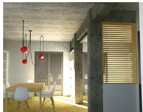
Νέοι τρόποι διαμόρφωσης των χώρων ενός παλιού διαμερίσματος από τη Διονυσία Τριανταφύλλου και τη Τζίνα Σκιαδά

Σε κάθε περίπτωση απουσιάζει, όμως, και η καταγραφή της αντίδρασης των κατοίκων στις προτάσεις των μελετητικών ομάδων. Αν όλα αυτά τα στοιχεία της επικοινωνίας και της διαπραγμάτευσης με τους κατοίκους στις διάφορες φάσεις του εγχειρήματος ήταν περισσότερο εμφανή, θα μπορούσε να αποτιμηθεί και το όλο εγχείρημα πιο εμπειριστικά. Μένει, έτσι, μετέωρο το ερώτημα αν αυτοί οι κάτοικοι και οι αντίστοιχες