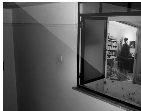
Η Όλγα Βενετσιάνου και η Αγγελική Σβορώνου πρότειναν τον μετασχηματισμό μιας κατοικίας σε εκθεσιακό χώρο με τη χρήση καθρεπτών, light box και προβολικών μηχανημάτων.