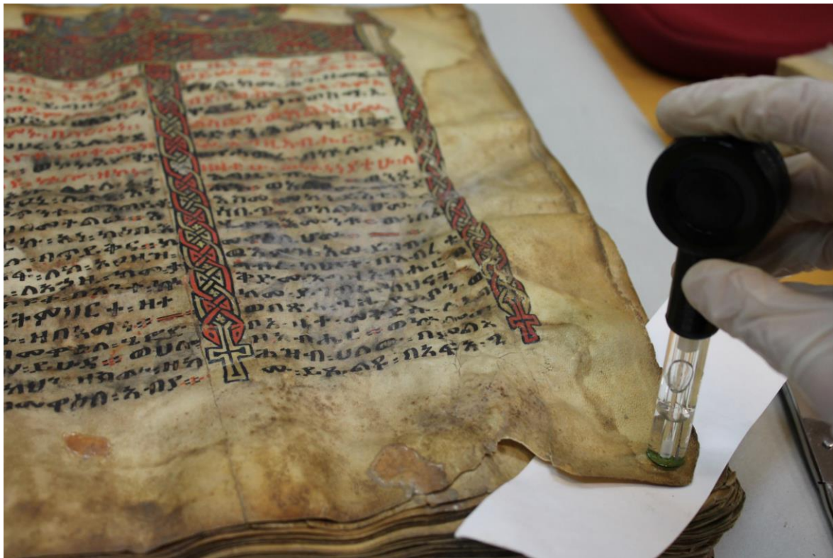
Fig. 16 - Rilevazione del pH tramite pHmetro a bulbo piatto