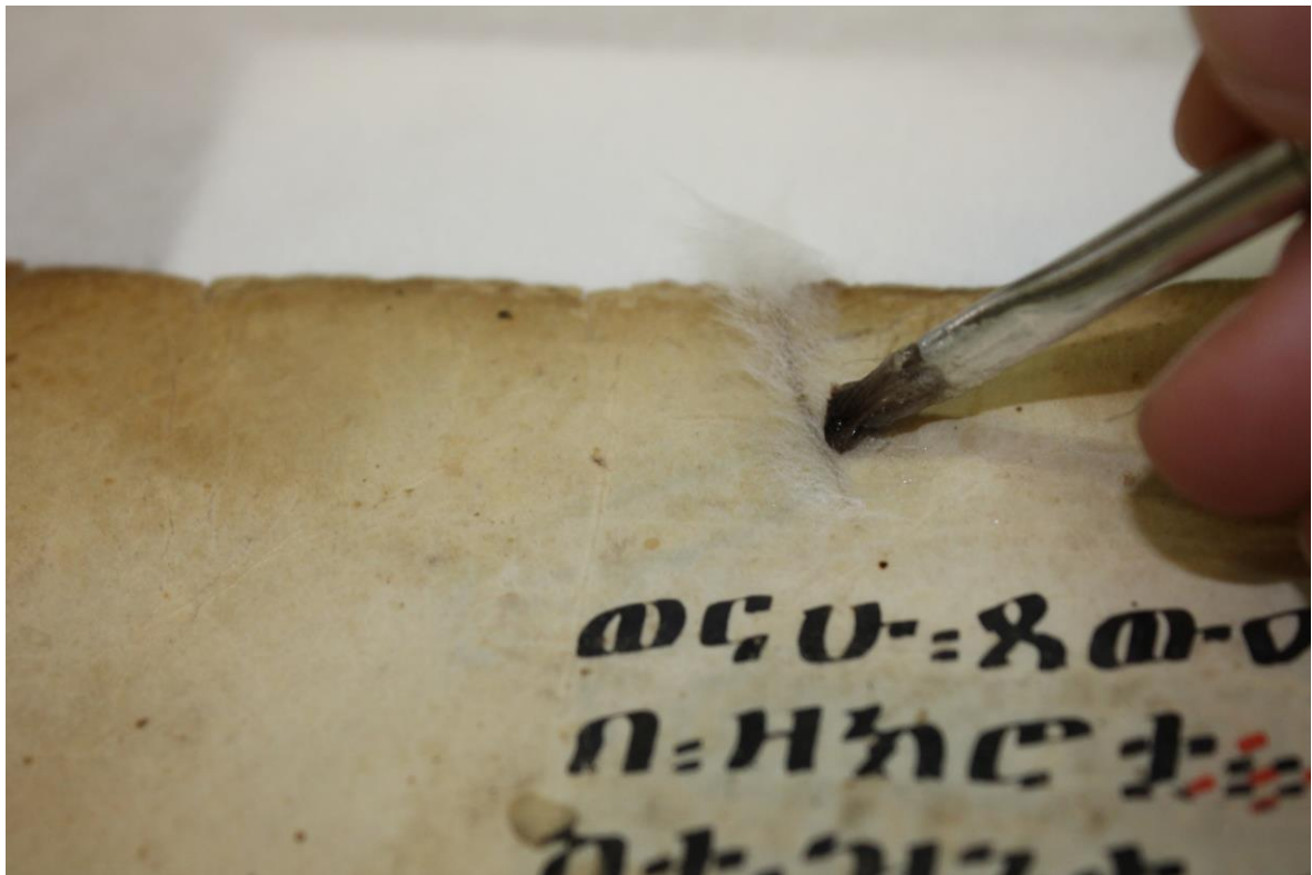
Fig. 13 - Sutura di uno strappo con velo giapponese