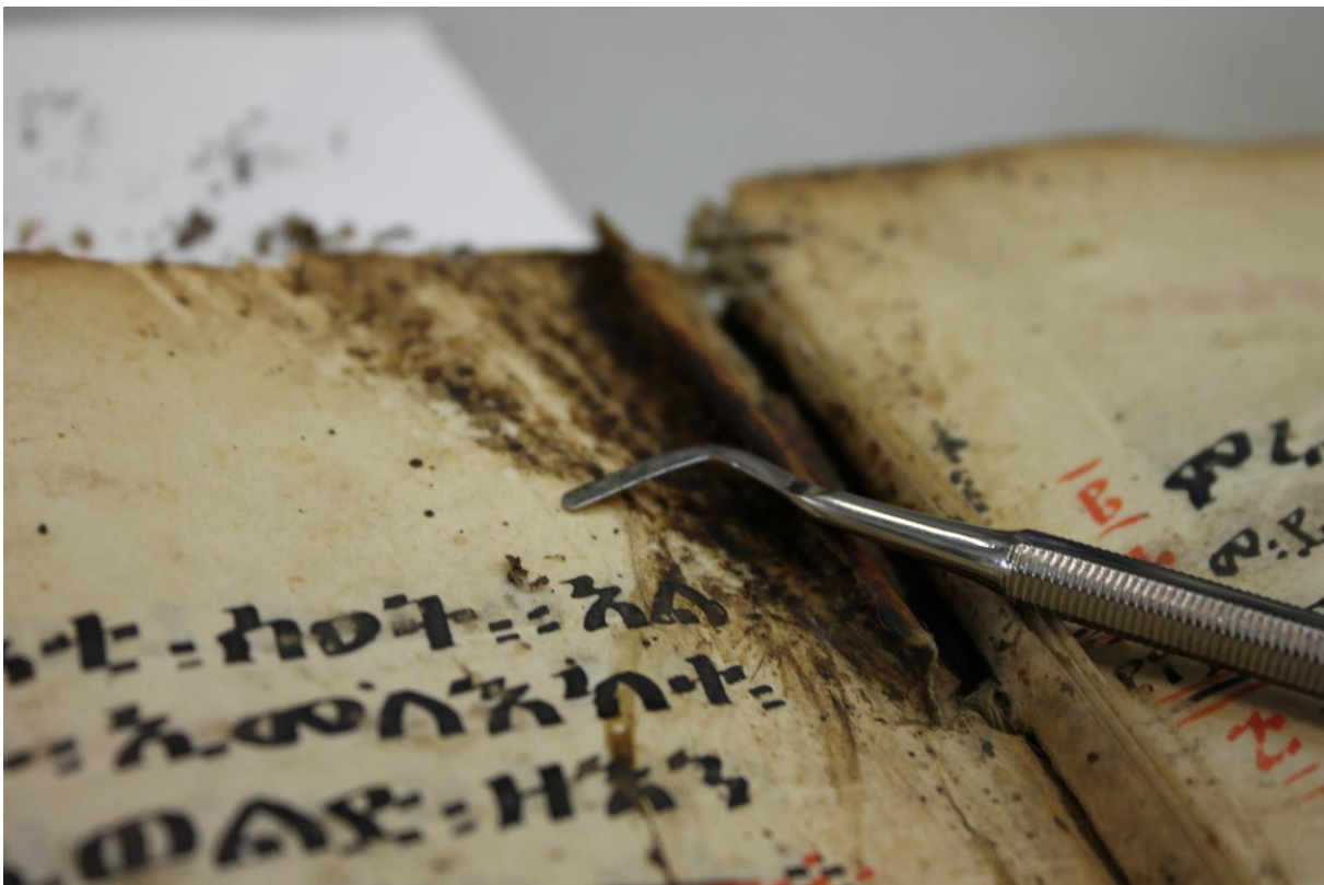
Fig. 15 - Distensione delle deformazioni alla piega

Per quanto riguarda la delicata situazione della piega dei fascicoli, si è stabilito di procedere seguendo due differenti strategie, a seconda della compromissione del supporto e dell'entità della lacuna. Nei casi di fratture o lacune mediamente gravi è stato creato uno strato di velo giapponese, fatto aderire su un secondo livello di carta giapponese. Nei casi invece di fratture o lacune molto estese è stato necessario intervenire con un doppio strato di carta giapponese, in modo da conferire maggior sostegno al supporto. In questo caso l'adesivo impiegato è stato sempre l'amido di grano ed il cromatismo è stato adeguato al supporto membranaceo tramite l'utilizzo di matite.