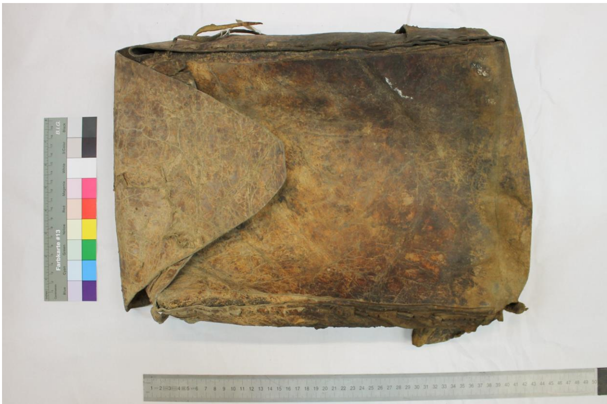
Fig. 7 - Custodia di cuoio (o mahdär )