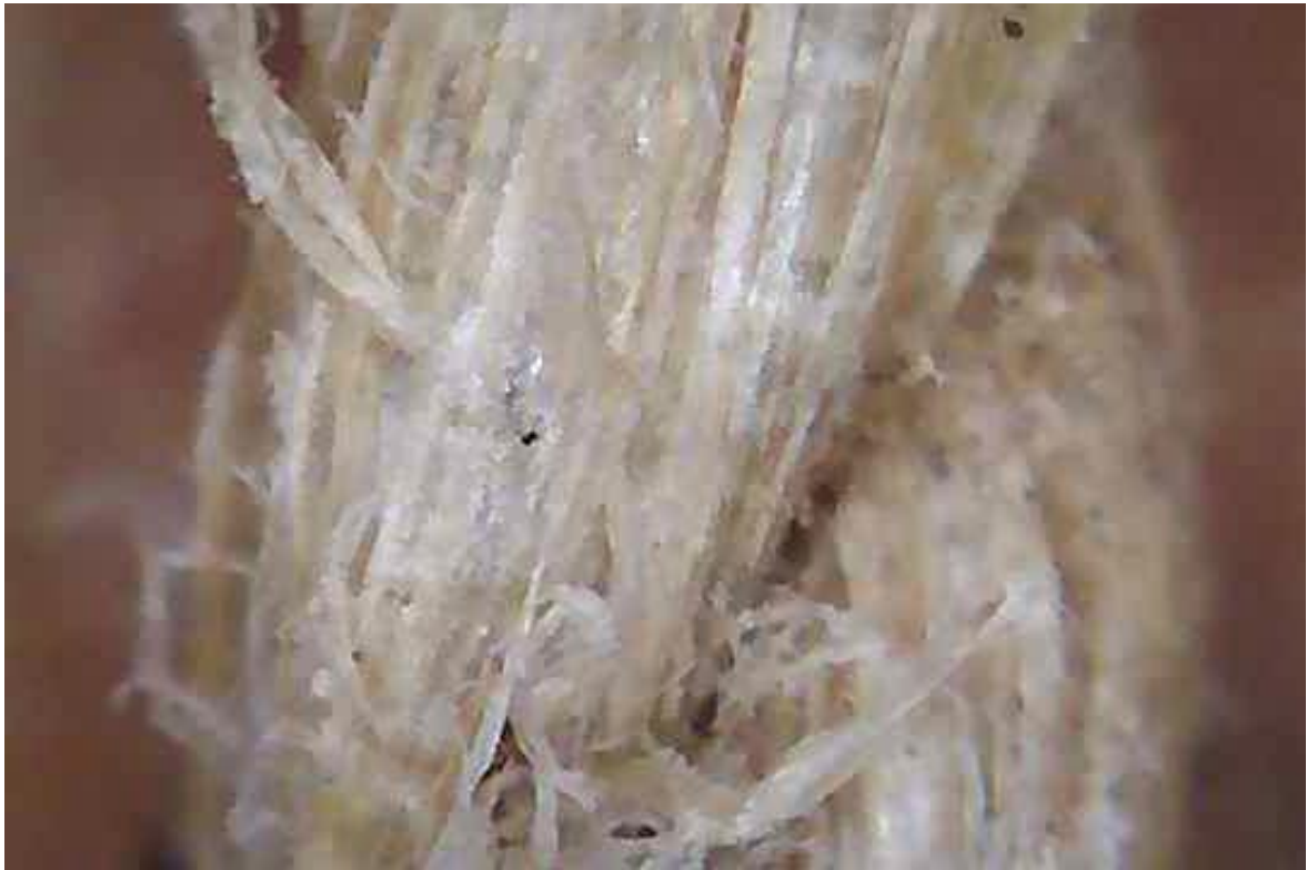
Fig. 6 - Filo di cucitura fotografato con il microscopio Dino-Lite