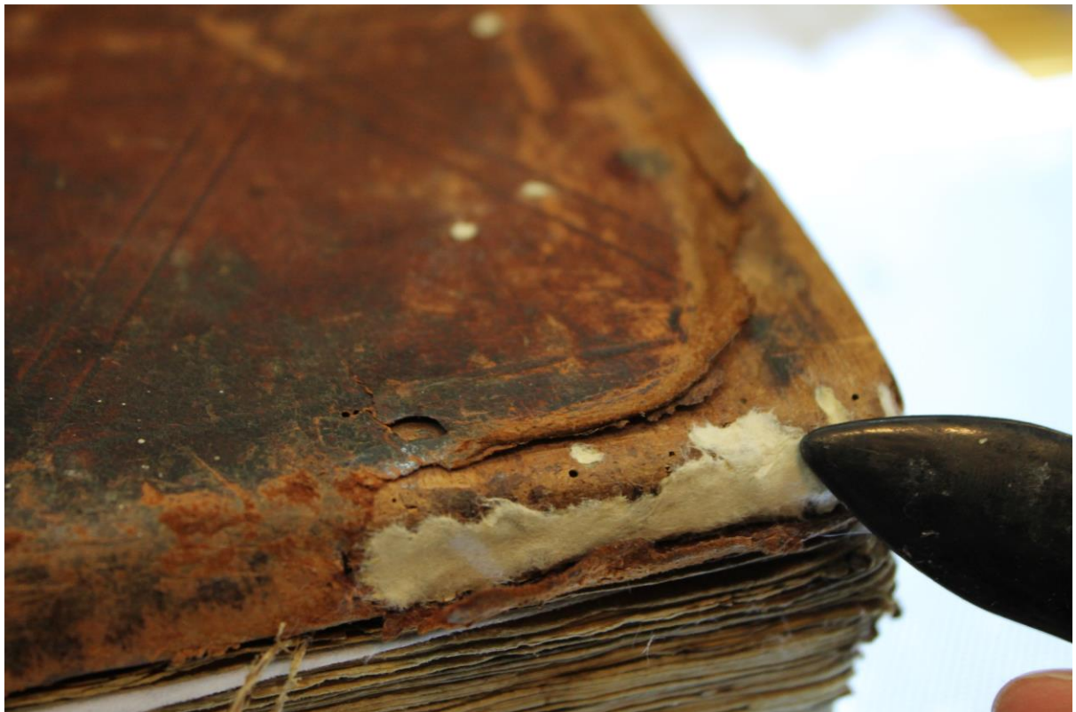
Fig. 11 - Stuccatura dei fori di tarlo presenti sull'asse lignea posteriore