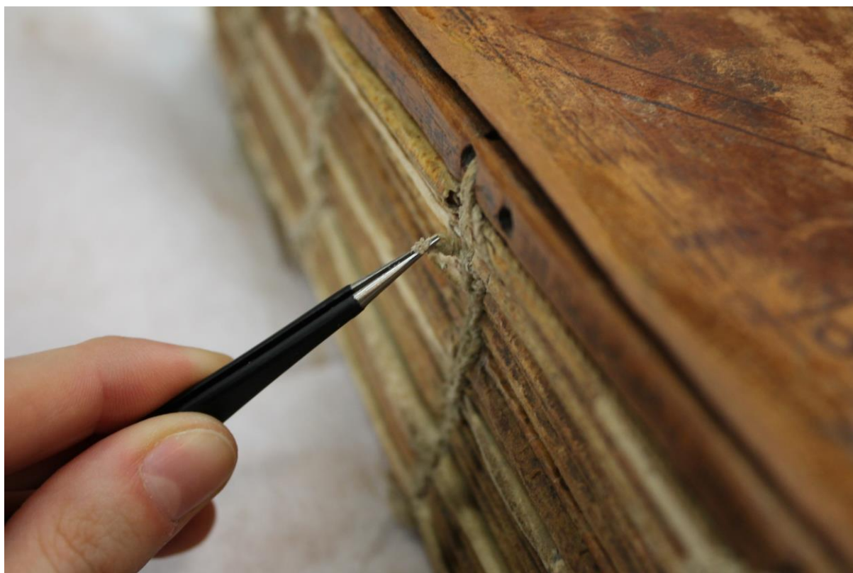
Fig. 12 - Analisi della cucitura in uno dei punti in cui era interrotta

Il rammendo originale in spago dell'asse lignea anteriore aveva quasi integralmente perso la propria funzionalità di collegare i due frammenti lignei, pertanto è stato necessario prolungare lo spago originale con un nuovo spago in canapa grezza che si agganciasse alle estremità interrotte di quello autoctono. La successiva operazione è consistita nel restauro del filo di cucitura, utilizzando uno spago di canapa di dimensioni leggermente ridotte rispetto all'originale, in modo da evitare un'eccessiva frizione nei punti di passaggio del filo, ma avente lo stesso numero di capi e la stessa direzione di torsione.