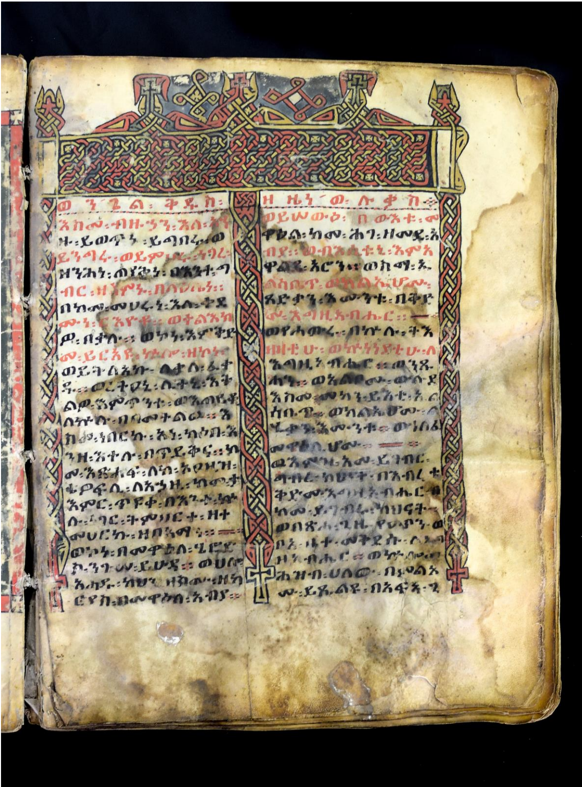
Fig. 2 - pagina incipitaria del vangelo di Luca (f. 98r)

franca romea (በርግጥ ፡ አፍርገጊ ፣), nella terra di Roma, nell'undicesimo anno dopo l'Ascensione e nel quarto anno di regno di Claudio.