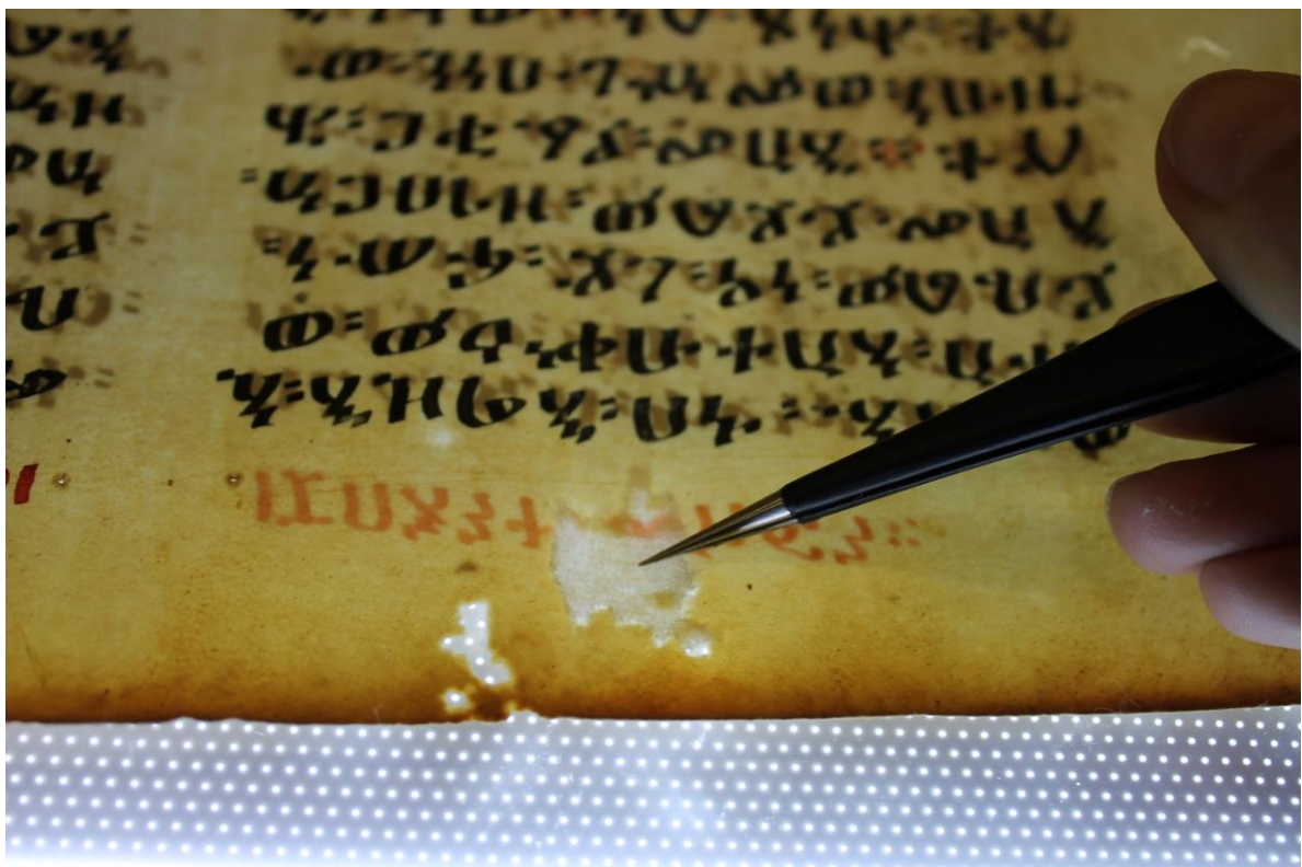
Fig. 14 - Risarcimento di una lacuna del blocco delle carte con carta giapponese