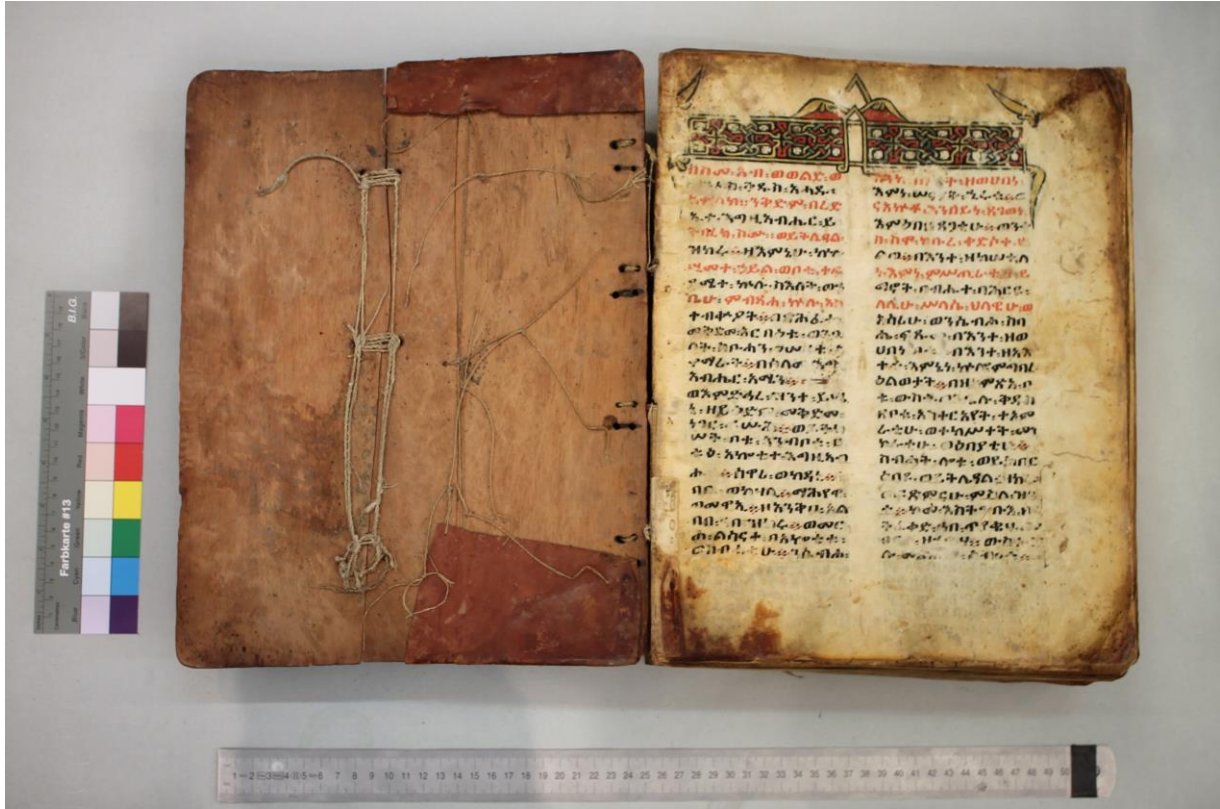
Fig. 1 - Piatto anteriore e pagina incipitaria (f. 1r)

Ff 12r–15r: Tavole dei Canoni eusebiani. In ǧəʕz: ሥርዓተ ፡ ቀመር ፡ ዘከመ ፡ ኅብሩ ፡ አርባዕቲ ፡ , «Disposizione dei canoni, secondo il modo in cui concordano i Quattro». Il testo è iscritto in tabelle eseguite con linee rubricate. Le tavole sono pubblicate nelle pagine introduttive dell’edizione di Täsfa Şəyon (Petrus Ethyops 1548).