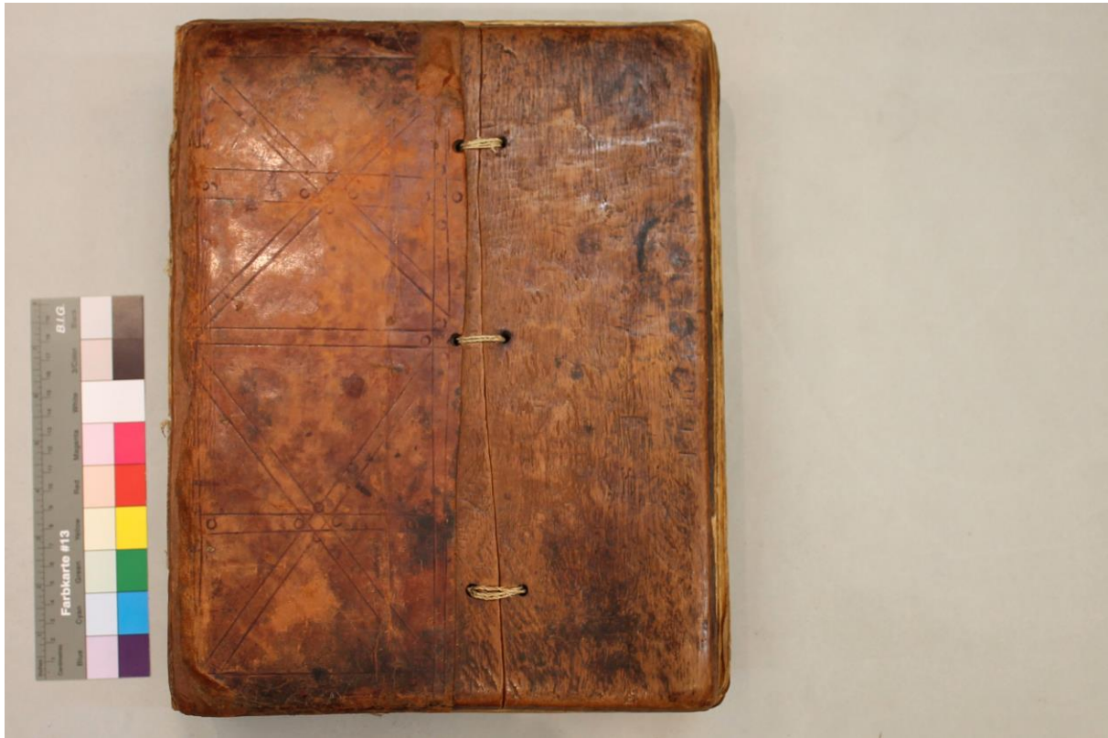
Fig. 5 - Piatto anteriore

Legatura etiopica tradizionale con piatti in legno e due coppie di stazioni di cucitura. Legatura tradizionale usuale a doppia catenella (o catenella a due fili) con materiale di origine animale (probabilmente tendini).