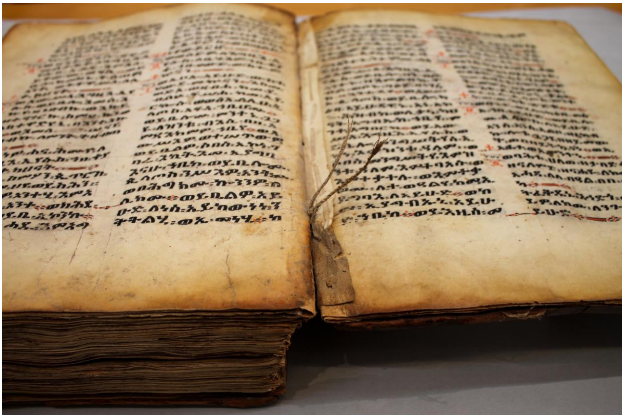
Fig. 4 – Braghetta di rinforzo intorno al fascicolo 23 (dopo il restauro)

Il manoscritto è costituito da 23 fascicoli, non numerati. I fascicoli nn. 5, 9, 10, 13, 14, 15, 16, 17, 18, 22 sono artificiali, comprendendo carte singole e corrispondenti talloni. Benché la presenza di fascicoli di questo tipo non costituisca di per sé un tratto insolito nella prassi etiopica, la composizione di alcuni dei fascicoli artificiali risulta di complessa interpretazione. I fascicoli 1, 5 e 23 sono muniti di una