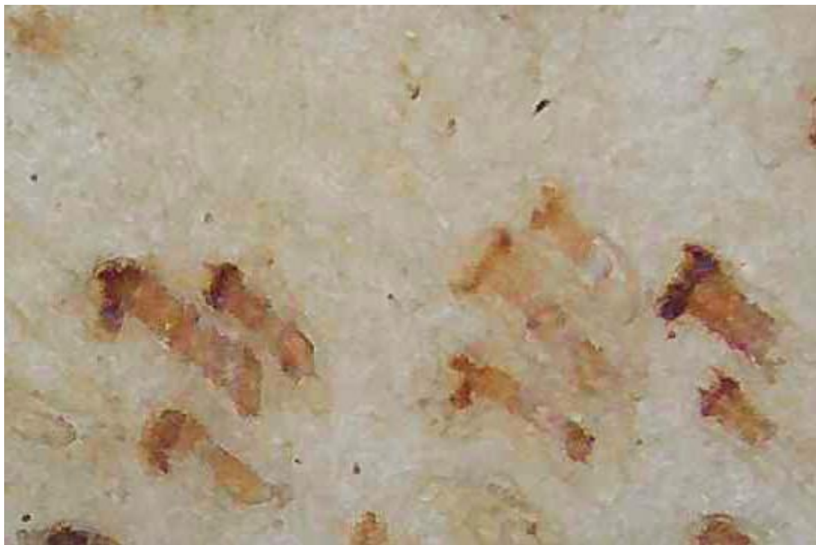
Fig. 3 - Pori piliferi caprini, fotografati con il microscopio Dino-Lite

La pergamena utilizzata per realizzare il manoscritto è di manifattura tradizionale etiopica. A sostegno dell'artigianalità del supporto, vi sono diverse particolarità: alcune estrinseche e rilevabili con un esame autoptico, altre intrinseche, rilevabili tramite l'impiego di strumentazione scientifica. Tra le peculiarità macroscopiche è possibile annoverare: lo spessore delle carte estremamente variabile (dai 0.10 mm ai 0.20 mm), le venature del tessuto della pergamena (rilevabili sul lato carne dell'animale