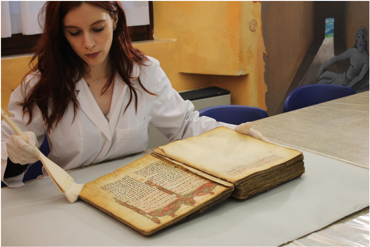
Fig. 10 - Pulitura a secco con pennellessa in pelo di capra