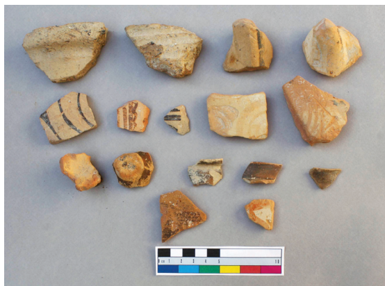
Εικ. 1. Όστρακα Πρώιμης Εποχής του Σιδήρου από τετράγωνο χώρο πλευράς 100 μ. στις ανατολικές πλαγιές του λόφου της ακρόπολης.