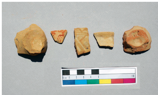
Εικ. 2. Όστρακα Πρώιμης Εποχής του Σιδήρου από τετράγωνο χώρο πλευράς 100 μ. στο βορειοδυτικό τμήμα του οικισμού.