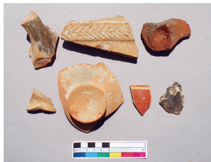
Εικ. 3. Όστρακα Πρώιμης Εποχής του Σιδήρου από τετράγωνο χώρο πλευράς 20 μ. ψηλά στη δυτική πλαγιά της ακρόπολης.