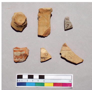
Εικ. 4. Όστρακα Πρώιμης Εποχής του Σιδήρου από τετράγωνο χώρο πλευράς 20 μ. ψηλά στη δυτική πλαγιά της ακρόπολης.