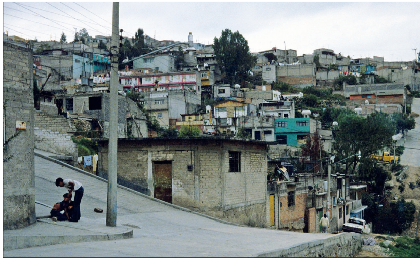
Figura 2. Lomas de San Agustín, Naucalpan, 1982.