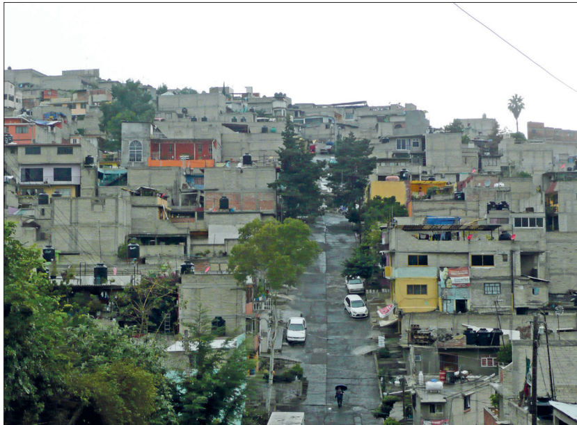
Figura 3. Lomas de San Agustín, Naucalpan, 2012.

cialmente con respecto a la que tenía en los años ochenta.